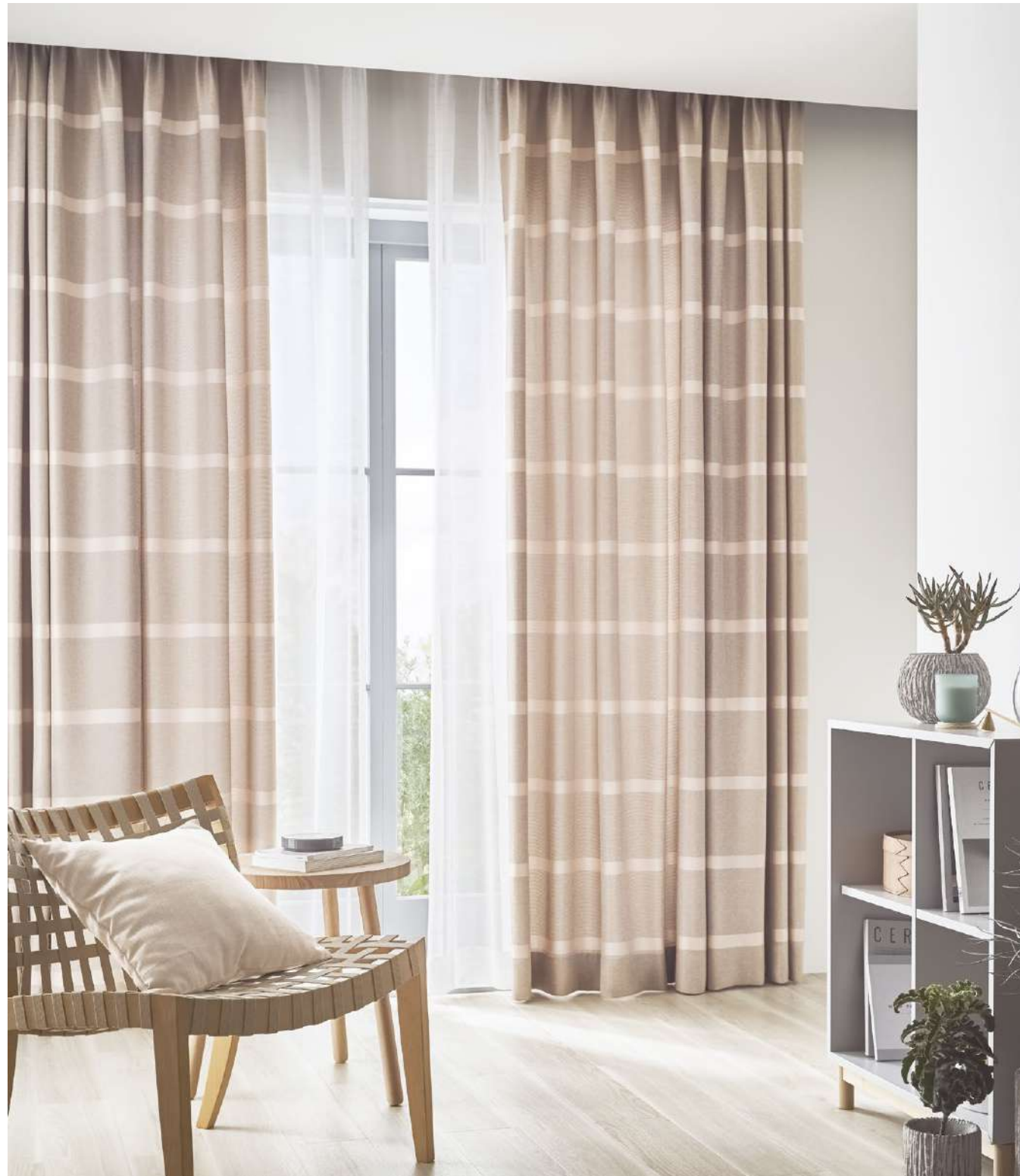
ドレープ LP: AC2056 シアー: AC2594(P.250) クッション: AC2025(P.19)