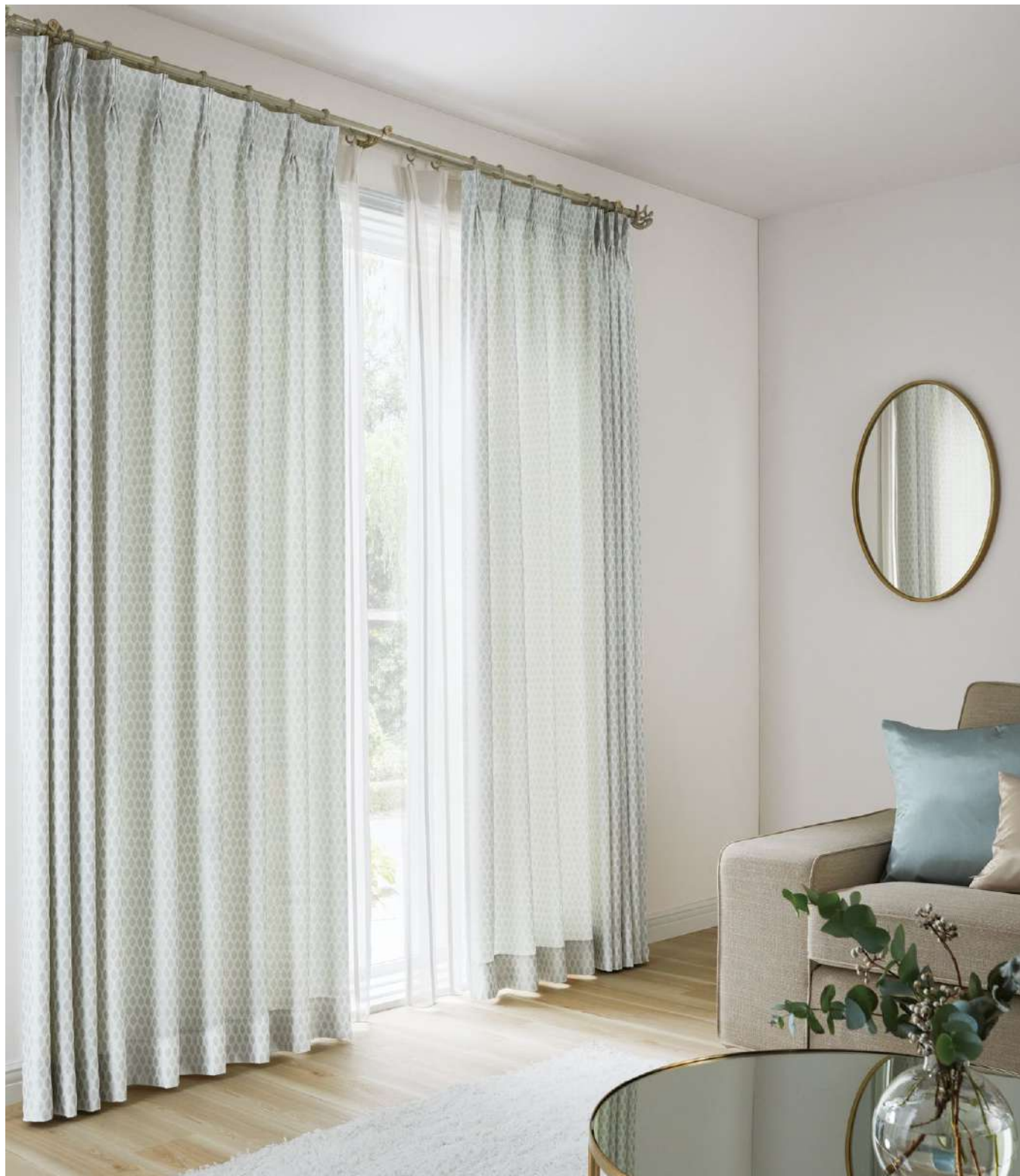
ドレープ [LP]: AC2235 シアー: AC2535 裾ウーリー (P.225) クッション: AC2338, AC2331 (P.144)