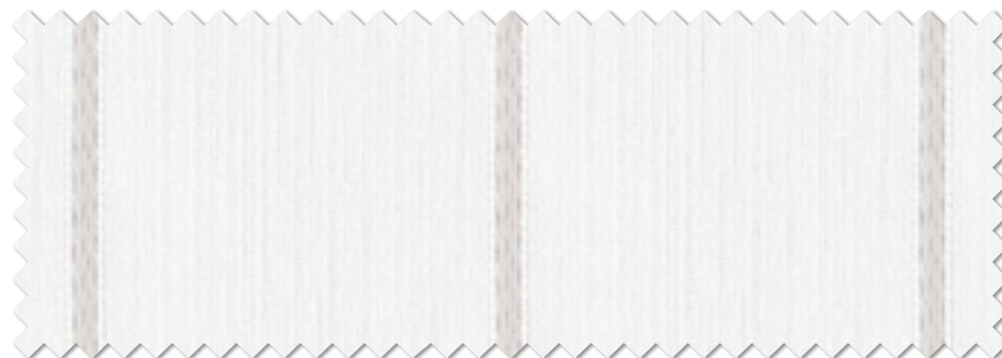
FT 6627 (LGR)