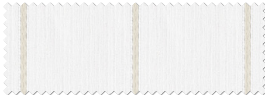
FT 6626 (BE)