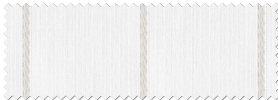
FT 6628 (GR)