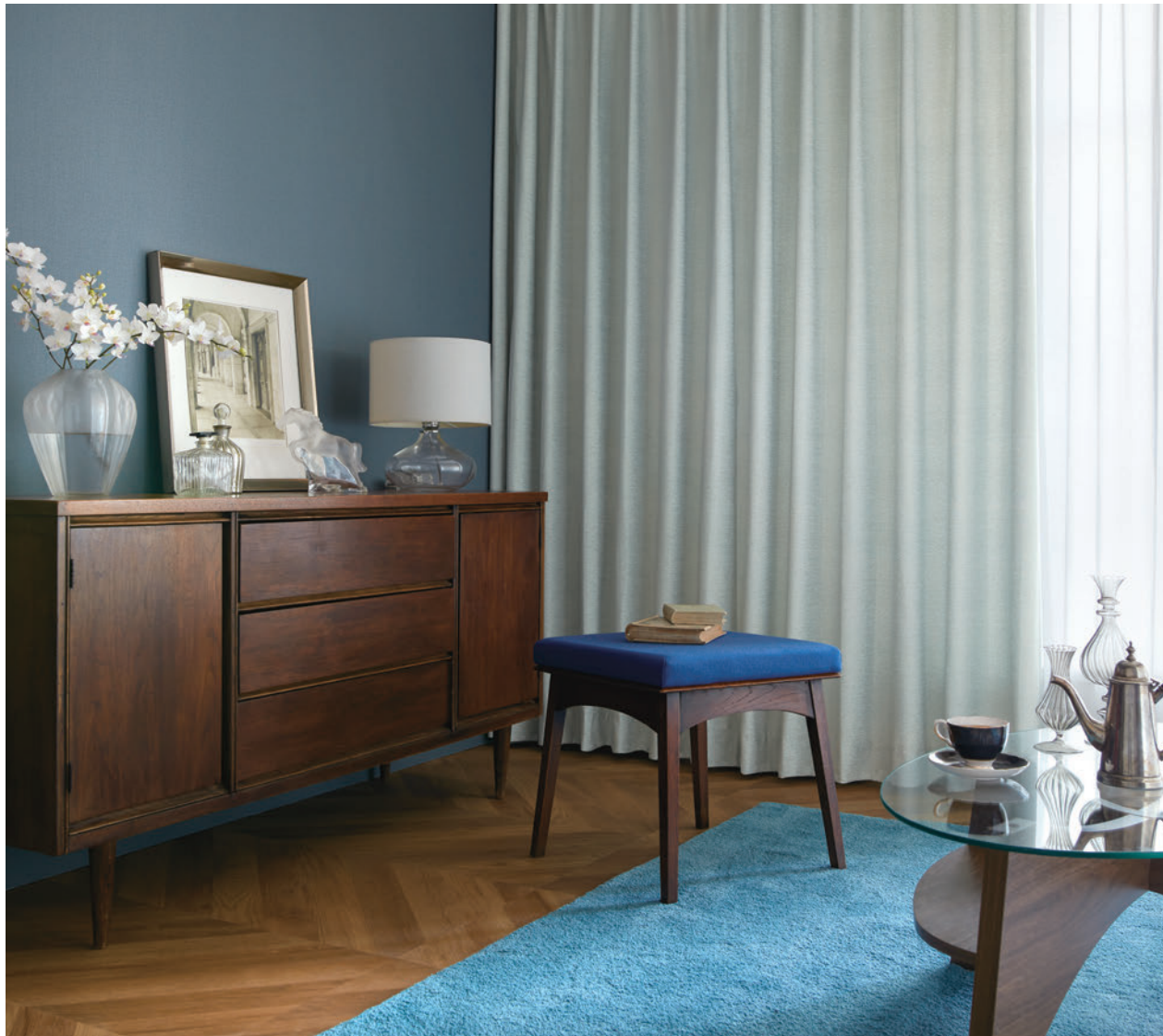
[ドレープ] TKF30004 ソフトプリーツ [レース] TKF30675 ソフトプリーツ [ラグ] TNF51013