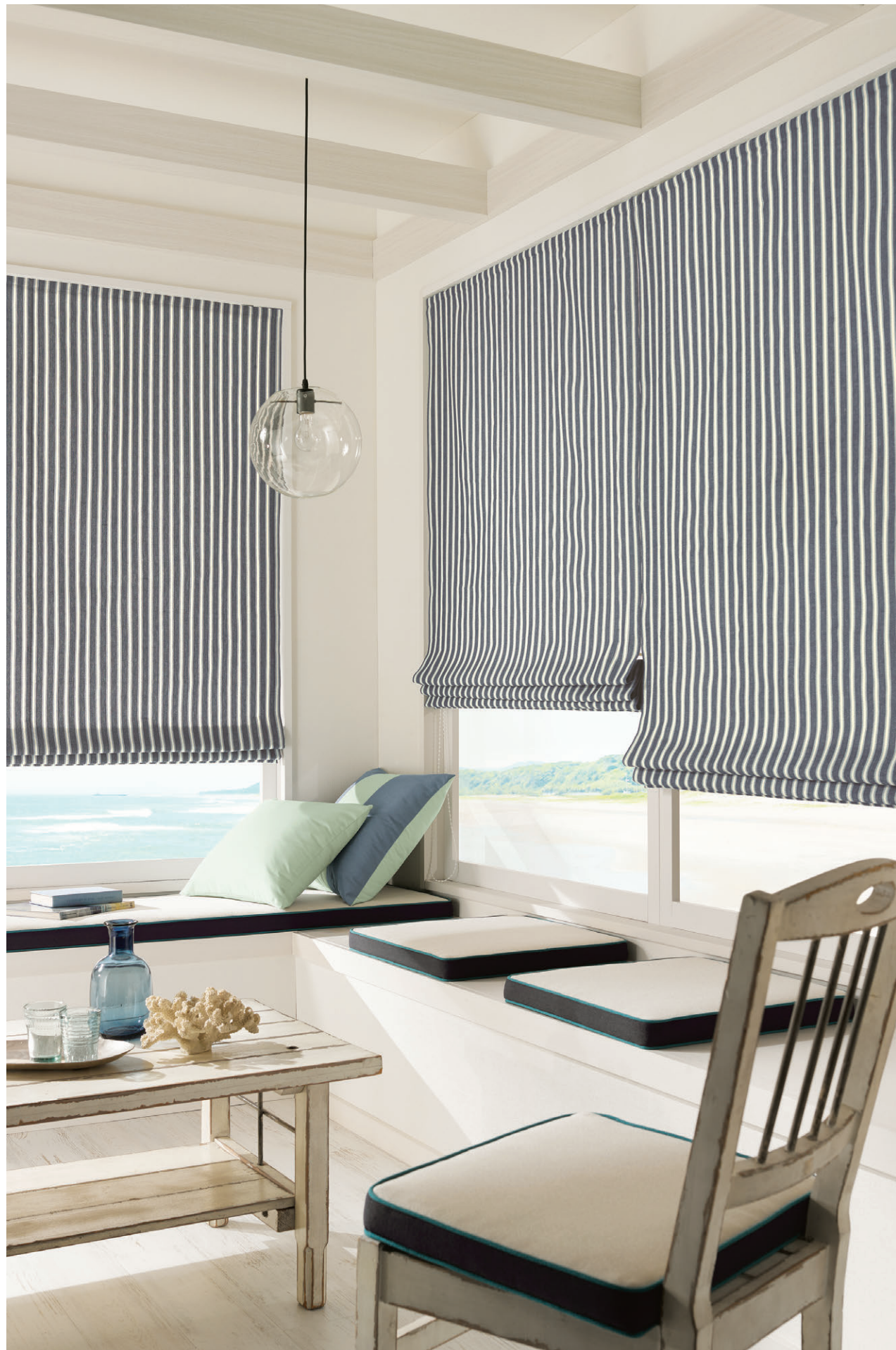
【プレーンシェード】TKF30088

○リピート/タテ-cm×ヨコ3.0cm ○組成/綿100% ○生産国/日本 ○寸法変化率/ドライ:タテ-3%・ヨコ-1% ○取扱い絵表示/T-A6