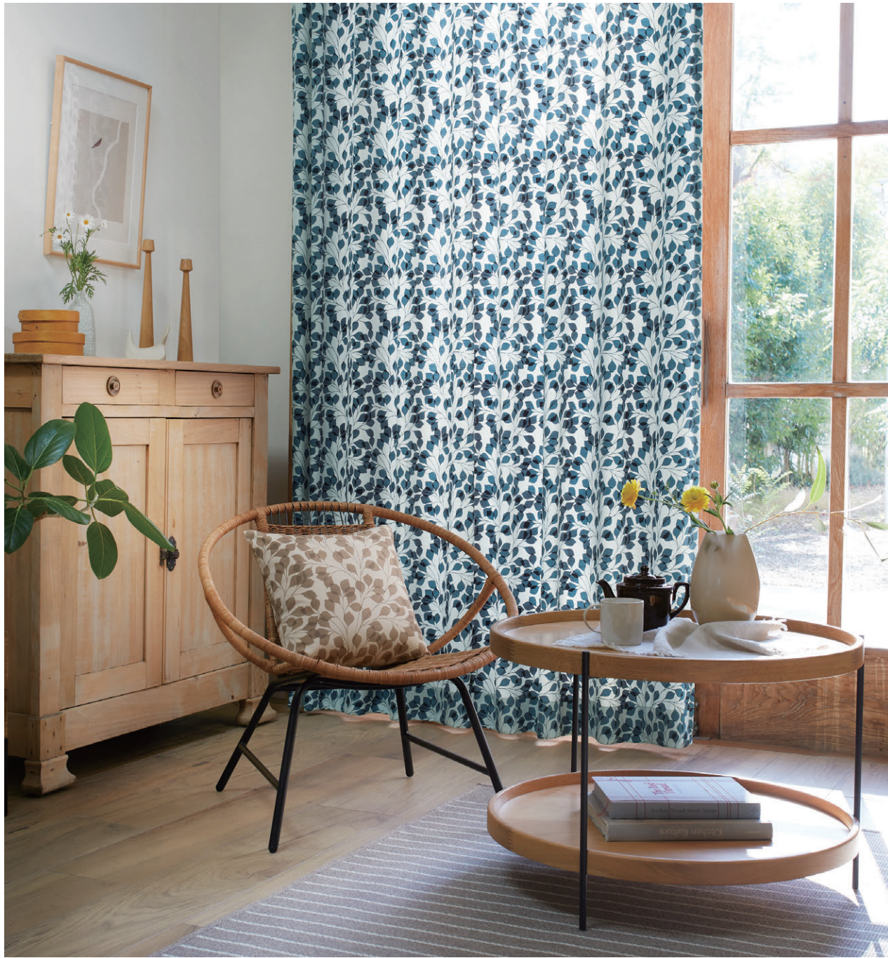
[ドレープ]TKF30114 フラット縫製 [クッション]TKF30113 CS-P [ラグ]TOR4703