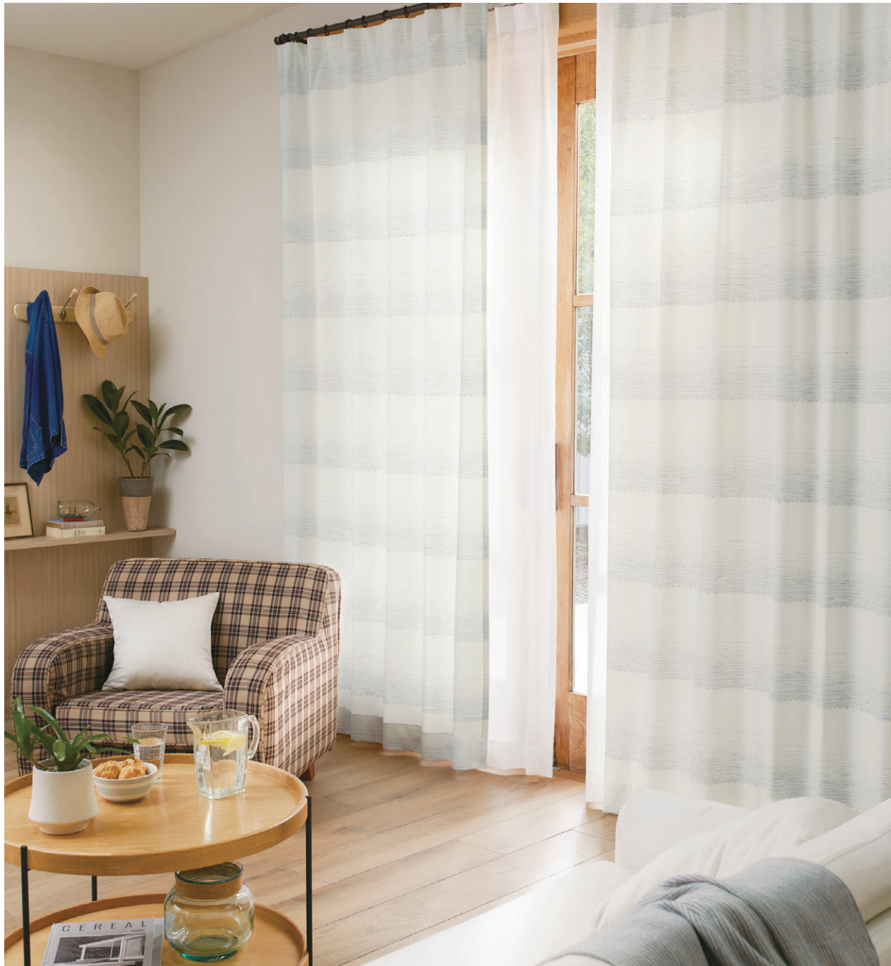
【ドレープ】TKF30158 フラット縫製 【レース】TKF30785 フラット縫製 【クッション】TKF30041 CS-P