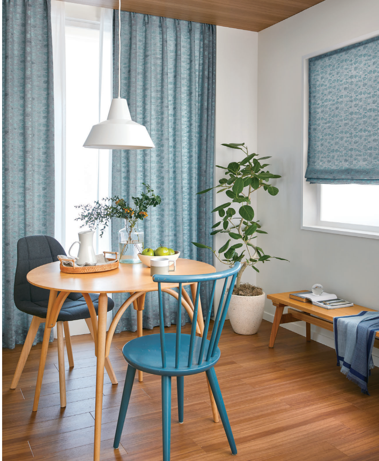
(左窓) [ドレープ] TKF30160 ソフトプリーツ [レース] TKF30691 ソフトプリーツ (右窓) [ブレースェード] TKF30160