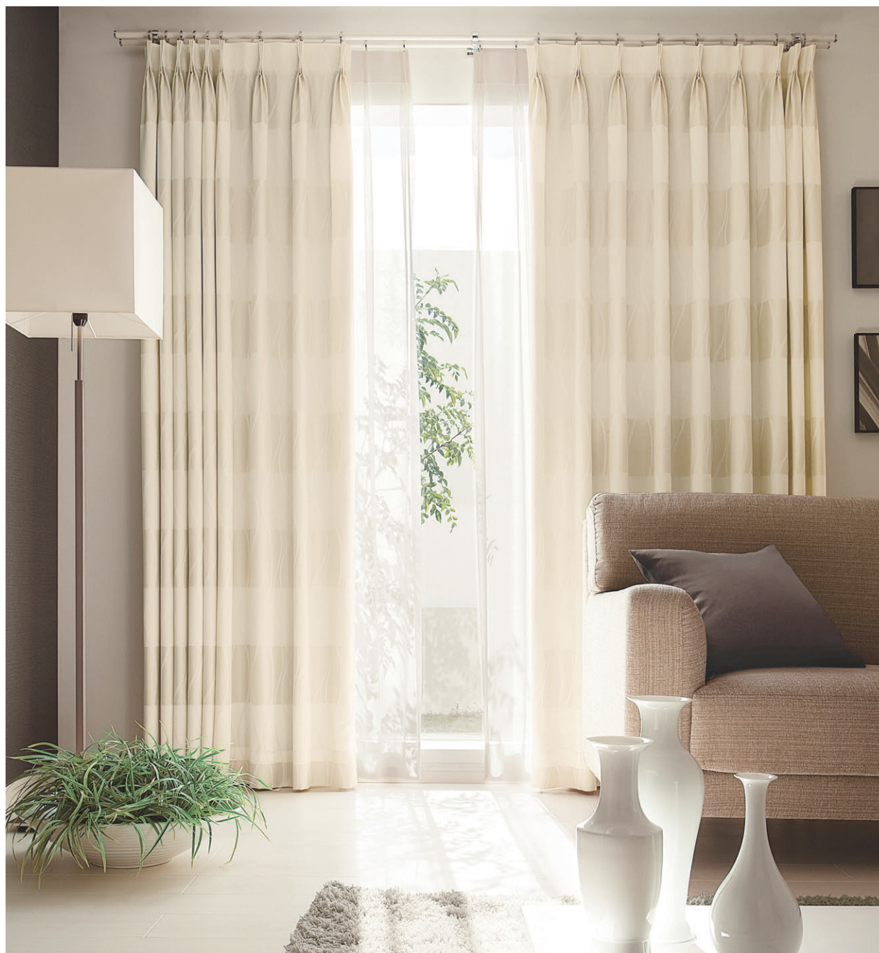
【ドレープ】TKF30195 ソフトプリーツ 【レース】TKF30693 ソフトプリーツ 【クッション】TKF30452 CS-P