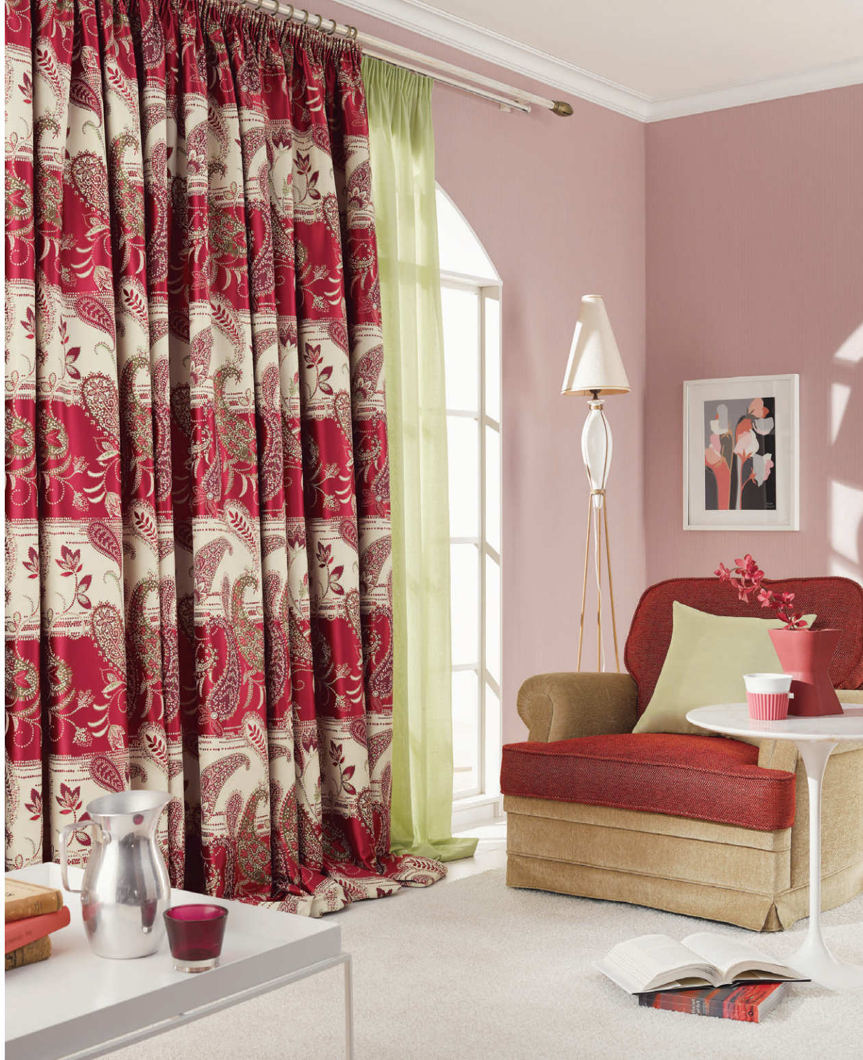
[ドレープ] TKF30248 ギャザー縫製 [レース] TKF30663 ギャザー縫製 [クッション] TKF30417 CS-P [ラグ] TNF50001