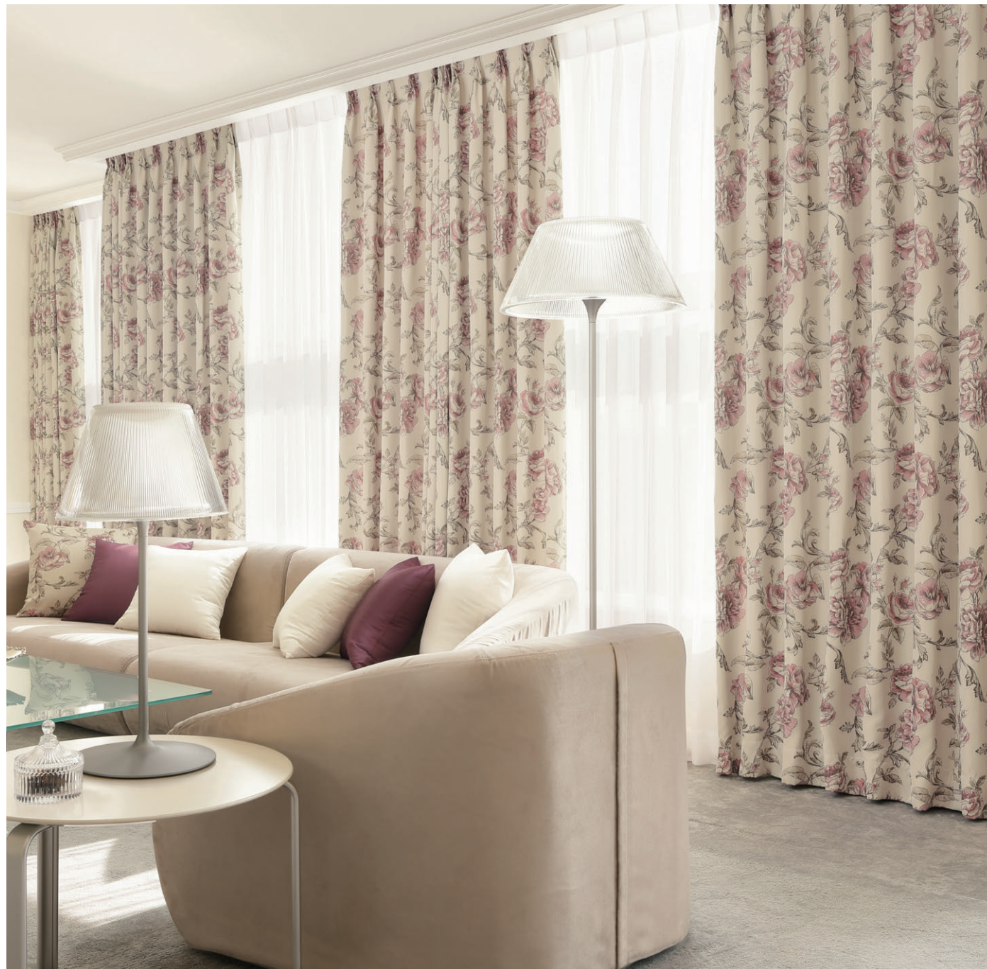
[ドレープ] TKF30249 ソフトプリーツ [レース] TKF30691 ソフトプリーツ [クッション] TKF30013 TKF30026 TKF30249 CS-P