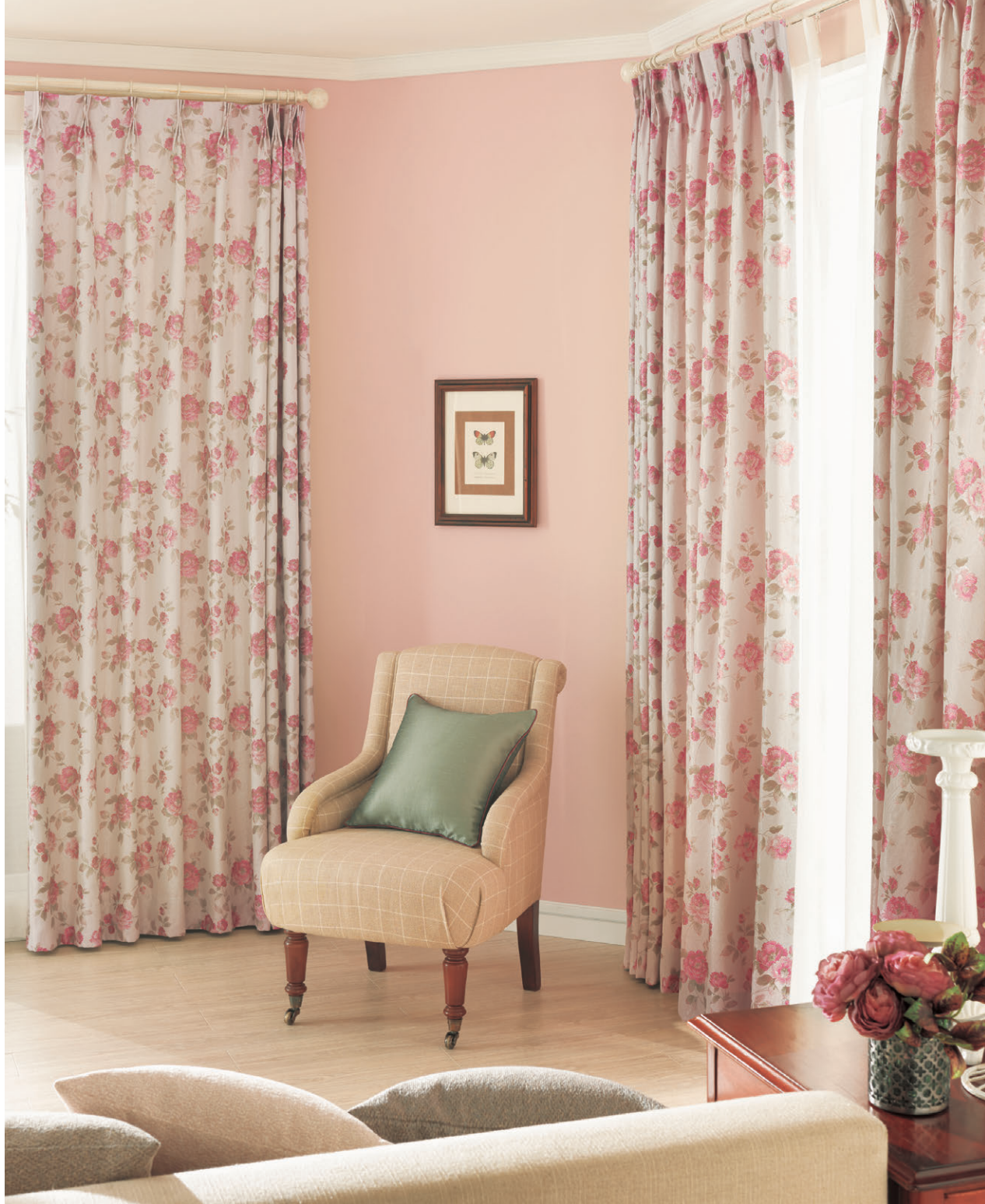
[ドレープ] TKF30253 ソフトプリーツ [レース] TKF30683 ソフトプリーツ [クッション] TKF30030 CS-T 別注縫製