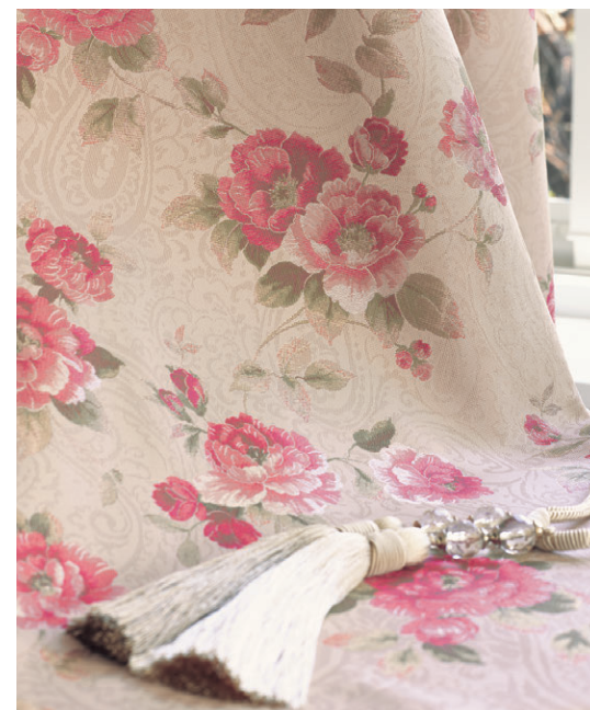
TKF30253 [タッセル] KX51301