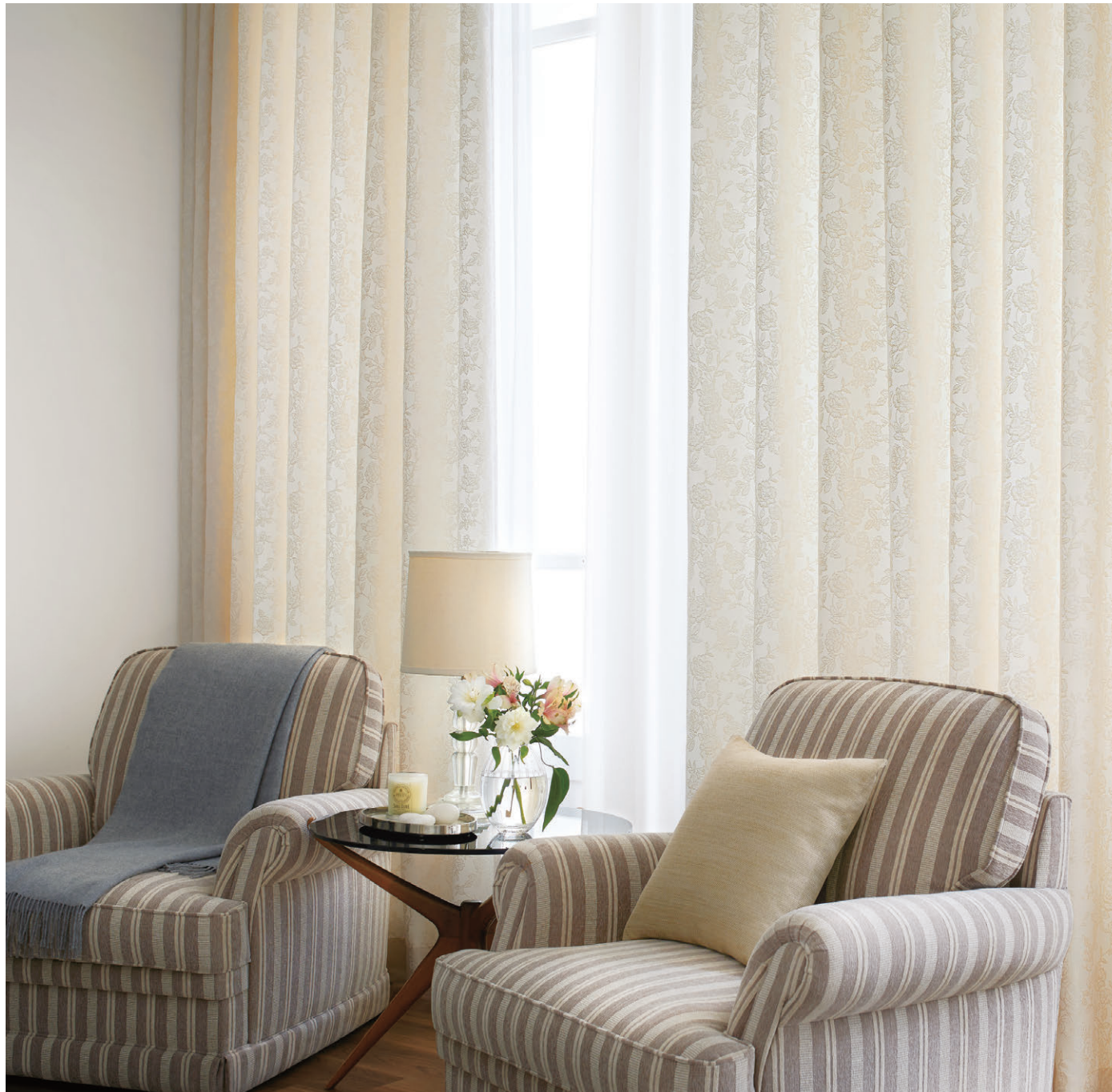
【ドレープ】TKF30276 ソフトプリーツ 【レース】TKF30675 ソフトプリーツ 【クッション】TKF30388 CS-P