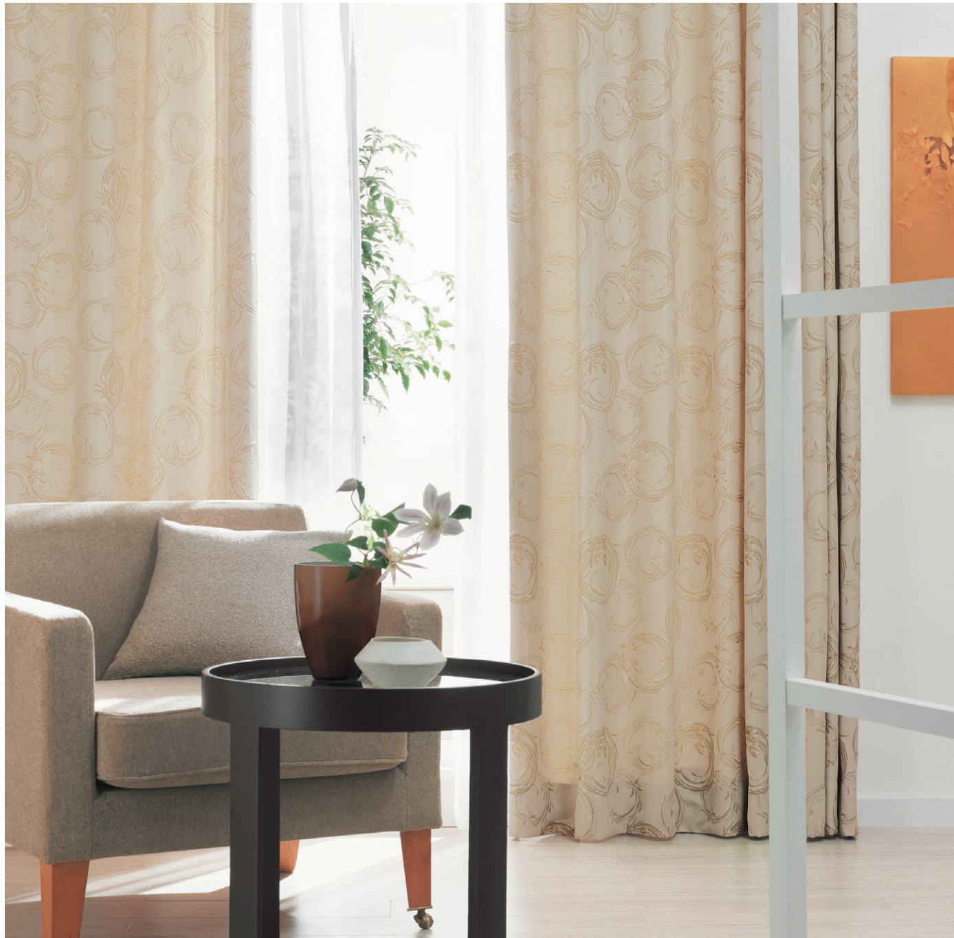
【ドレープ】TKF30336 ソフトプリーツ 【レース】TKF30688 ソフトプリーツ