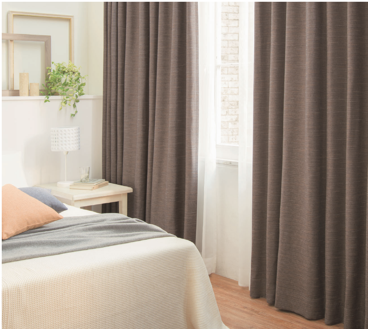
[ドレープ] TKF30517 ソフトプリーツ [レース] TKF30695 ソフトプリーツ