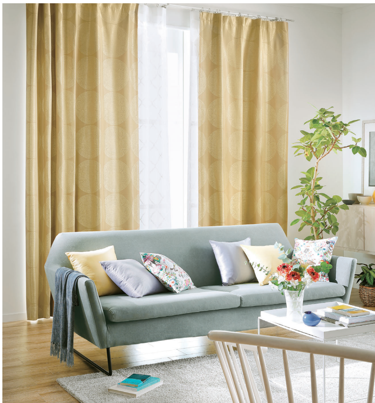
【ドレープ】TKF30589 フラット縫製 【レース】TKF30646 フラット縫製 【クッション】TKF30051 TKF30053 TKF30534 CS-P 【ラグ】TNF29002