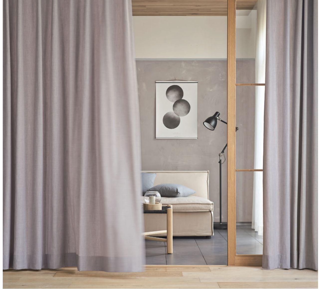
LS-63190 / レース LS-63523