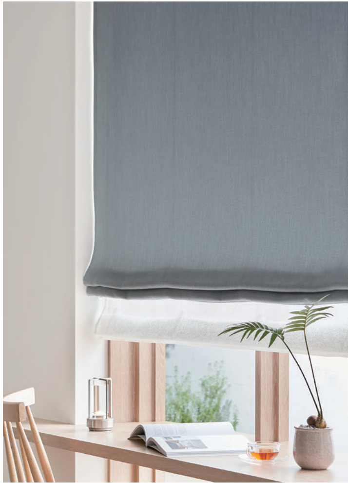
ダブルシェード(ブレン+ブレン) 65-63191+63523