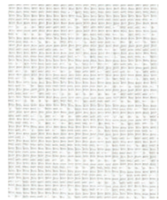
ウォッシュابل / 遮熱 / 防カビ / ミラー