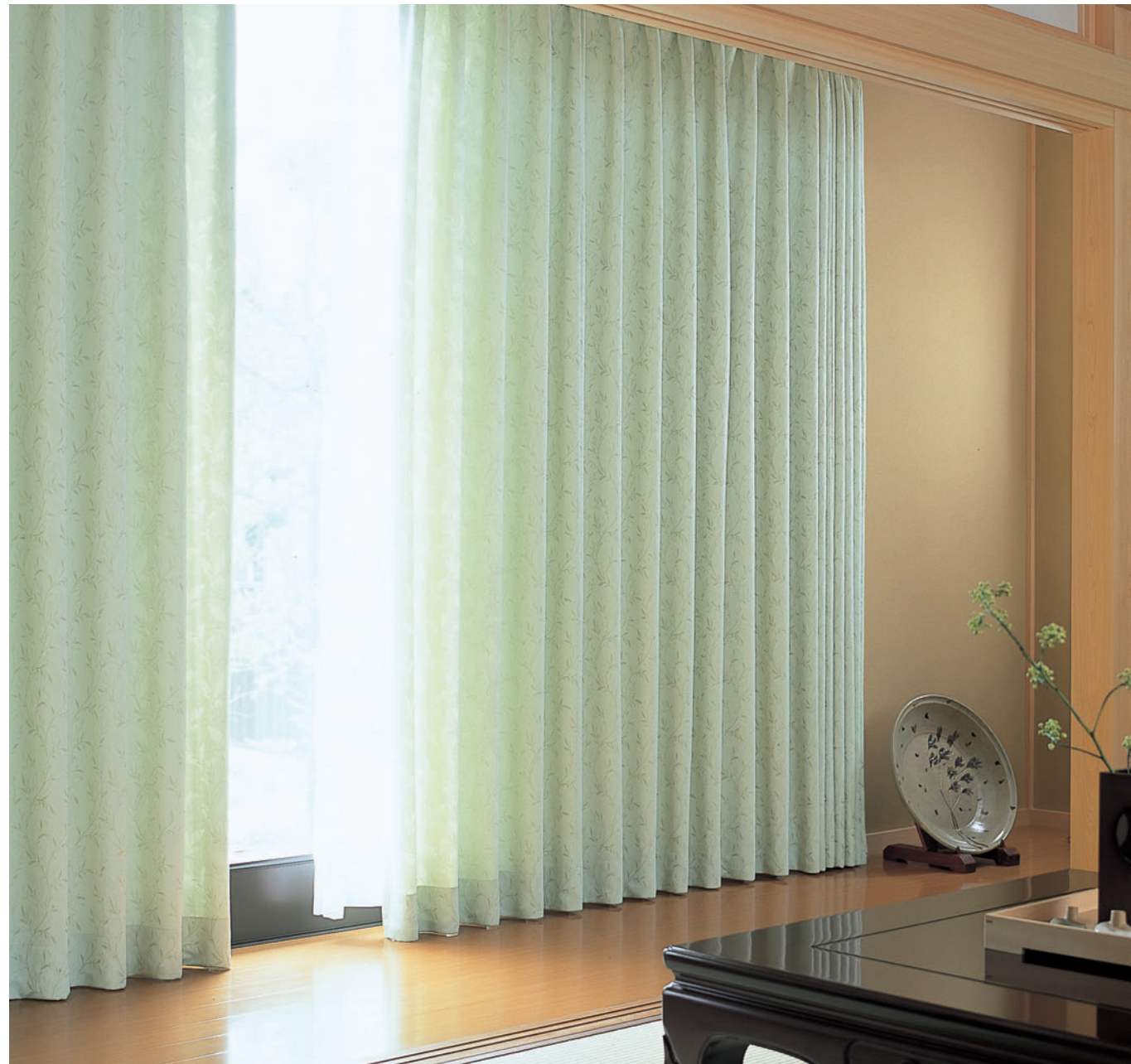
LS-63320 / レース LS-63470