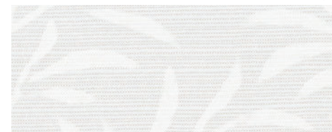
ウォッシュابل / ウェーブロン® / 遮像