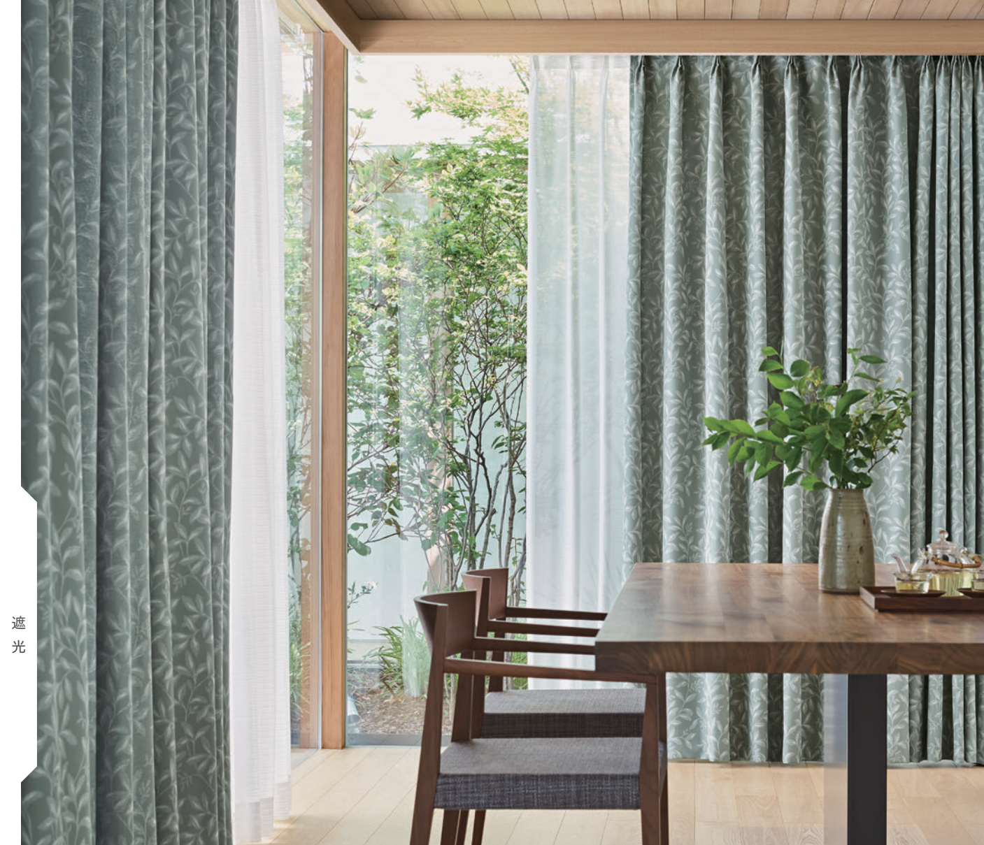
LS-63369 / レース LS-63474