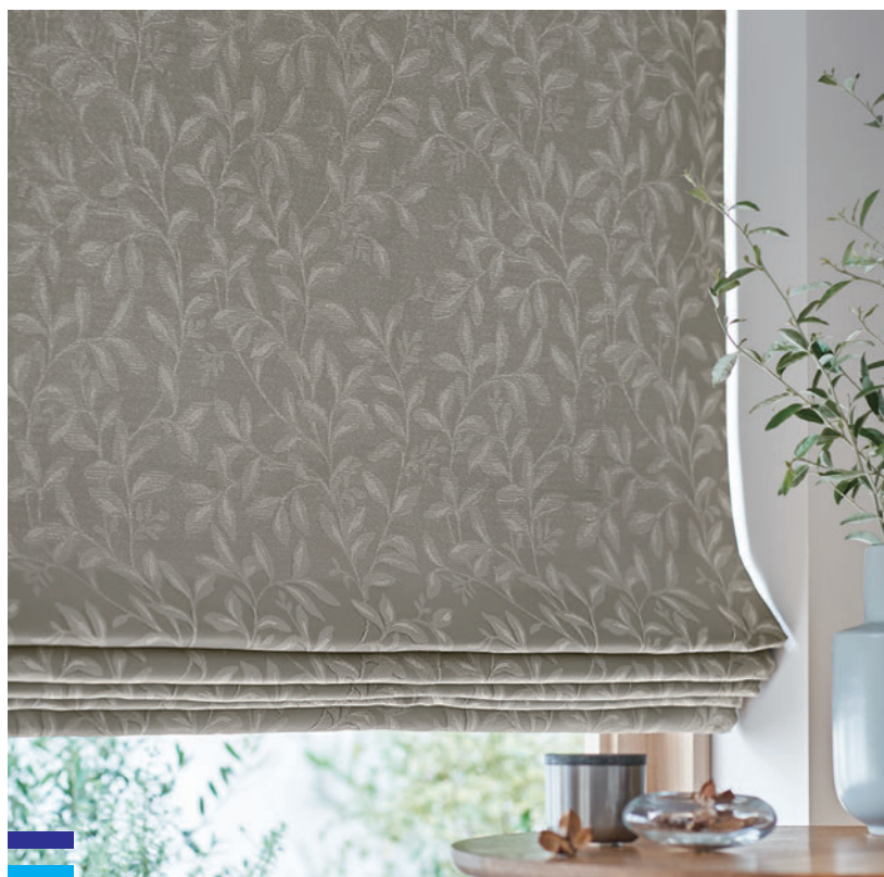
ブレースシェード 60-63368