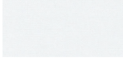
ウォッシュアブル