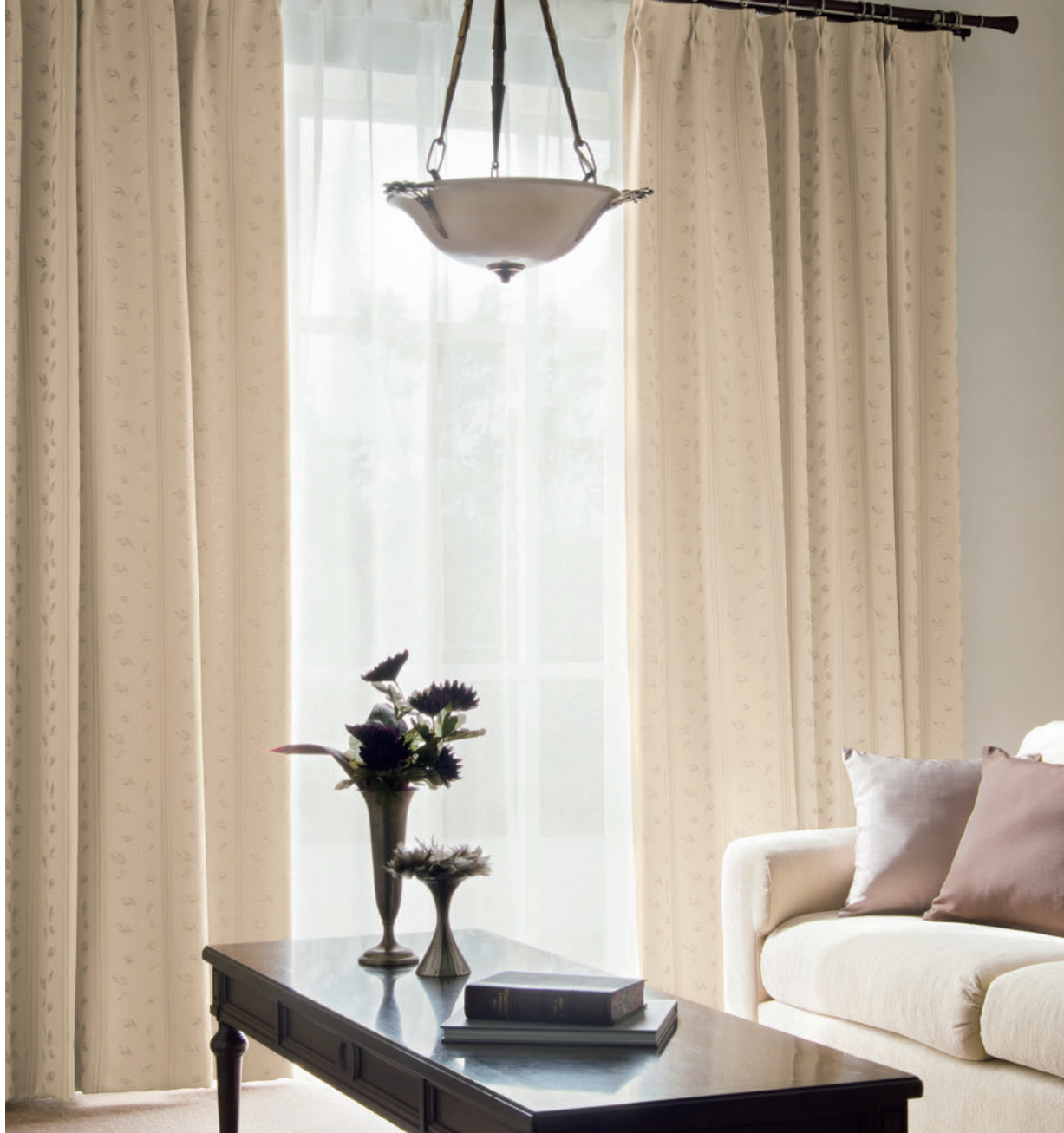
LS-63383 / レース LS-63507