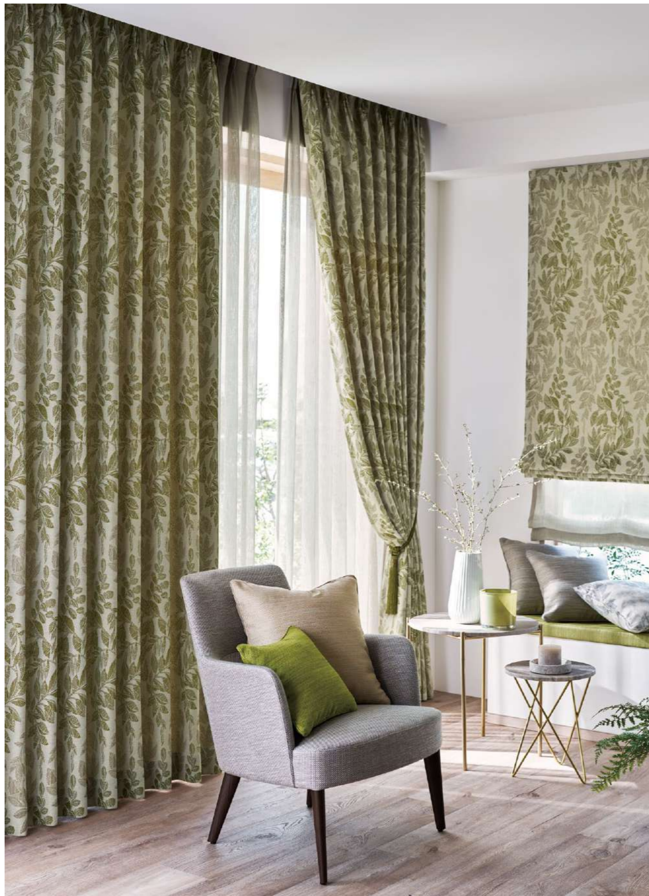
ドレープ : SC7046 シアー : SC7598(P.266) タッセル : FN1424 ツインシェード(プレーン+プレーン) : (前幕)SC7046 (後幕)SC7598(P.266) クッション : SC7297、SC7295、SC7298(P.115)、SC7047