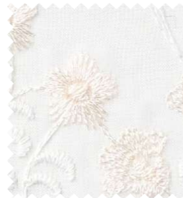
SC7550 見えにくさ C B A A+

※刺繍商品のため、糸の切れ目や小さな針穴が目立つことがあります。 ※生地製の製法上、表面の引きつれや糸切れにご注意ください。 ※裾刺繍仕上げのため、シェードの裾部分の仕上げが通常とは異なります。 ※生地製の製法上、若干の湾曲が生じる場合があります。 ※生地製の製法上、刺繍糸の末端が飛び出す場合があります。