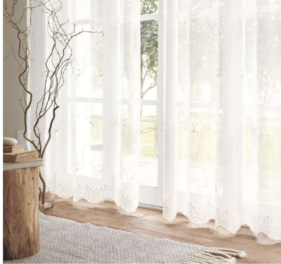
フラットカーテン(1.5倍) : SC7550