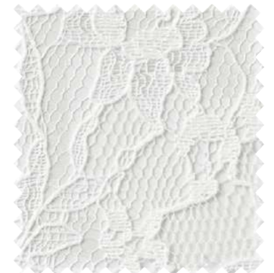
SC7551 見えにくさ C B A A+

※生地製の製法上、縫製時に柄が合わない場合があります。 ※生地製の製法上、伸び縮みしやすいため、お取り扱いにはご注意ください。 また、表面の引きつれや糸切れにもご注意ください。