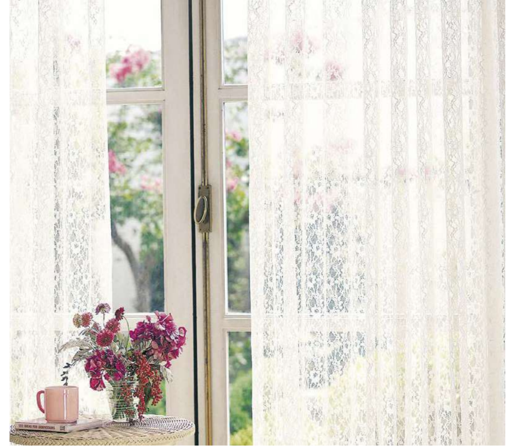
シアー : SC7551