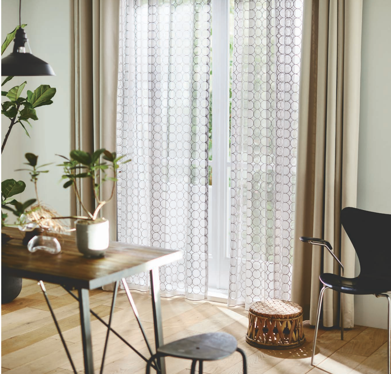
U-5045 (フラット) ドレープ:U-5258